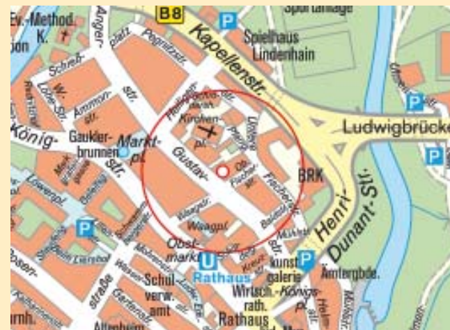
Karte: STADT FÜRTH, Stadtplanungsamt/Abt. Vermessung

Mit der Bahn: vom Bahnhof aus entweder mit der U-Bahn (U1) Richtung Klinikum eine Station fahren bis Rathaus, dann über die Waagstraße in die Gustavstraße (3 min.) oder vom Bahnhof zu Fuß (ca. 15 min.) durch die Fußgängerzone (Schwabacher Straße) in Richtung Rathaus, von dort über die Waagstraße in die Gustavstraße.